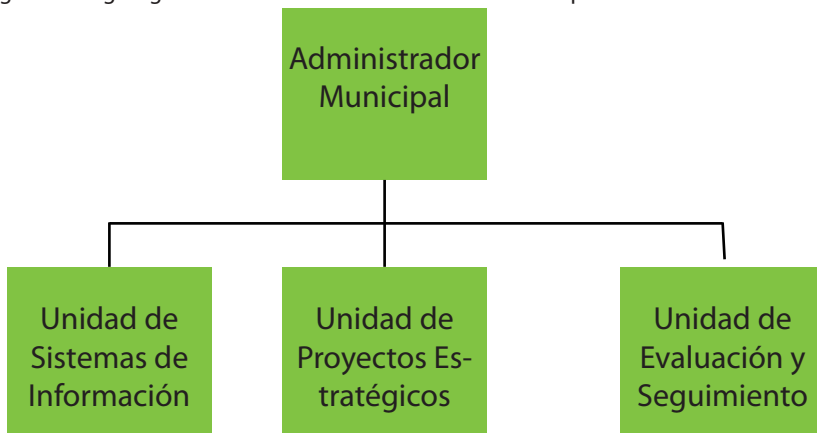
Figura 2. Organigrama interno del administrador municipal.

Las unidades que proporcionaban apoyo al administrador municipal se muestran en el organigrama interno.