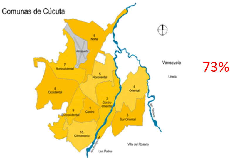
Figura 1 Ubicación geográfica de las familias deportadas de Venezuela en la ciudad de Cúcuta, Colombia

lia, arriendo o refugiados en el centro de migraciones ubicados en el barrio El Pescadero y otros municipios, como Los Patios, Villa del Rosario, Bochalema y el Zulia de la ciudad fronteriza de Cúcuta, Norte de Santander. El instrumento que se utilizó para obtener la información requerida es la encuesta, donde se solicitaba información en las dimensiones: Socioeconómica y de movilidad, con el fin de conocer las causas de migración de estas personas hacia Venezuela y de esta misma forma las de su retorno, como se mencionó anteriormente.