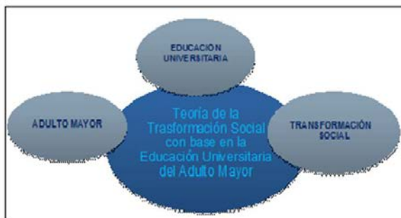
Figura N°.1 Identificación de constructos de la teoría.

En este orden de ideas, cada constructo permitió durante el desarrollo de la fundamentación y postulado, identificar a su vez, las premisas teóricas y la relación e integración que ofrece la coherencia interna de la teoría. Planteamiento teórico en el cual resalta la figura del adulto mayor como actor principal, quien encontrará en la educación universitaria una opción, para lograr coadyuvar a la transformación social a intervenir a partir de sus habilidades motoras y cognitivas de reserva ante el contexto socioeducativo venezolano. Experiencia académica innovadora que ha de considerar la realidad biopsicosocial de este grupo etario, tal y como se explica en la Figura N°1.