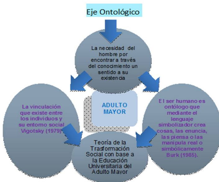
Figura N° 2 Identificación del eje ontológico de la teoría.

Al intervenir el texto del cuerpo del postulado teórico de manera analítica, se pueden destacar las palabras clave y planteamientos e identificar las premisas y los ejes ontológico, epistemológico, axiológico y metodológico que fundamentan la teoría. Se resalta de manera subrayada la premisa nudo o esencia. Pero antes se recomienda ver una serie de figuras que ilustran los referidos ejes y finalmente la representación gráfica de la Teoría de la transformación social con base en la educación universitaria del adulto mayor .