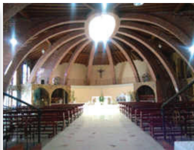
N° 12. Iglesia de Nuestra Señora de Fátima. Localización: calle 2 entre carrera 1 y avenida 19 de abril, Barrio Sucre.