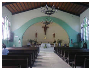
N° 7. Iglesia de Cristo Rey. Localización: avenida Libertador, Urbanización Las Lomas.