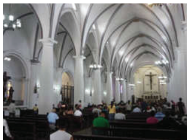
Nº 2. Iglesia de San Juan Bautista. Localización: carrera 4 entre calles 13 y 14, La Ermita.