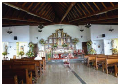
Nº 11. Iglesia del Corpus Christi. Localización: avenida España con carrera 3, Pueblo Nuevo.