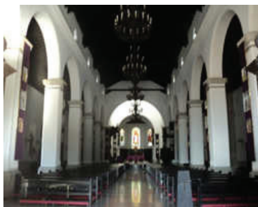
Nº 1. Catedral de San Cristóbal. Localización: calle 4 con carreras 3 y 4.