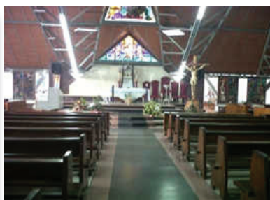
Nº 10. Iglesia de Nuestra Señora del Carmen. Localización: carrera 12 entre calles 3 y 4, La Concordia.