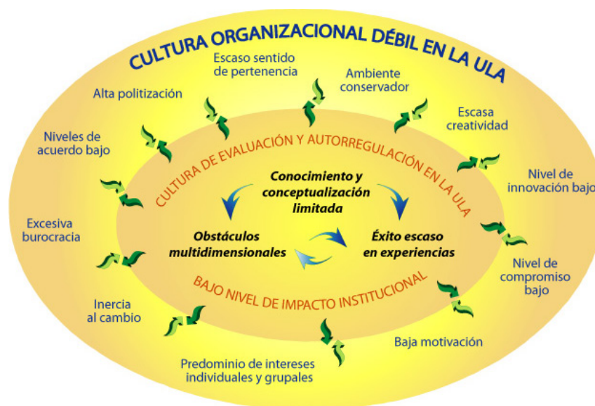
Gráfico 2. Una visión de la situación de la cultura de evaluación institucional y autorregulación en la ULA.