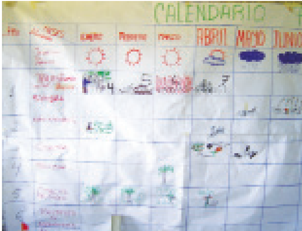
Figura 4. Calendario productivo.

Esta comunidad identifica 5 meses de verano (noviembre-marzo) y los restos de los meses se presentan con fuertes precipitaciones.