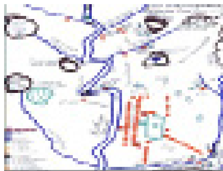
Figura 2. Mapa de la comunidad.

A pesar de que el Cerro Autana está alejado de la comunidad, es representado en el mapa porque se divisa desde el poblado y además es considerado como el origen de los Piaroa. Los bosques son los lugares que ocupan mayor superficie en la comunidad, representando más del 70 % del área.