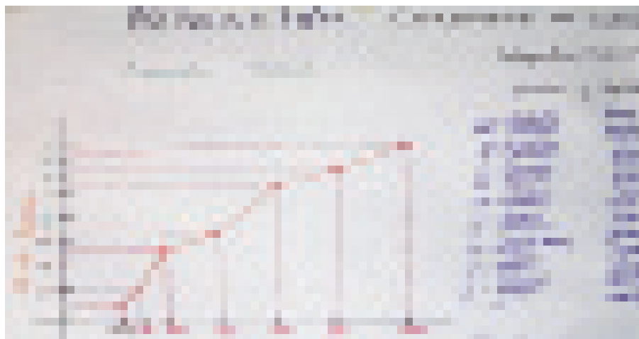
Figura 5. Tendencia del número de familias (1970 al 2005).

La comunidad de Coromoto Cuao tenía en los inicios de los años 70 una población muy baja, lo que se infiere por el número de familias que la constituían, entendiéndose por familia el grupo de personas formado por el padre, la madre, y sus hijos solteros. A inicios de esa década sólo existían alrededor de 3 familias quienes fueron los fundadores del asentamiento. A partir de ese momento hubo un incremento acelerado en el número de familias hasta la década de los 90 (Figura 5), a partir de allí el incremento de la población no es tan acelerado como en las décadas anteriores, ello debido en parte a emigraciones de algunas familias (Tabla 2).