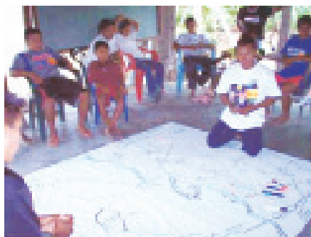
Figura 1. Elaboración del mapa de la comunidad.