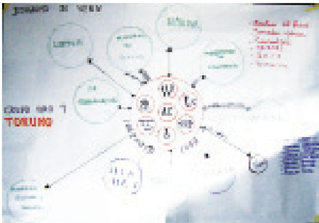
Figura 3. Diagrama de Venn comunidad Coromoto de Cuao

Al comenzar la realización de esta herramienta la comunidad identificó dentro de sí, como instituciones propias, a una Asociación Civil, la Medicatura, el Hogar de Cuidado Diario, la iglesia, la biblioteca, e inclusive un equipo de fútbol (Figura 3). Aunque cada una de estas asociaciones fueron establecidas con ayuda del gobierno o organismos encargados, esta comunidad siente como suya cada una de las antes nombradas, y es por ello que la incluyen dentro de su constitución como grupo.