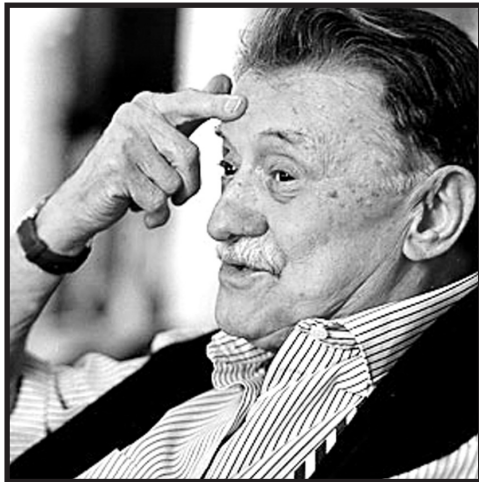
Cinco minutos bastan para soñar toda una vida, así de relativo es el tiempo.

D esgastadas páginas amarillentas de tanto sumar horas, días, años, décadas. Libro desarmado de andanzas remotas en morrales de juventud. Las Cotidianas de Mario Benedetti, nuestros primeros poemas libres, de lectura para el gozo. Contigo descubrimos la poesía escondida en las palabras sencillas. Gracias por mostrarnos tu voz, con el ritmo y las pausas de tu arte. Respirar para componer, respirar para recordar y volver a leer.