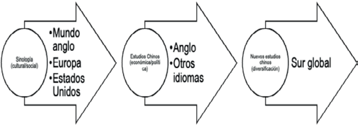
FIGURA 1. EVOLUCIÓN DE LA SINOLOGÍA A LOS ESTUDIOS CHINOS

En este estudio, la sinología se refiere en términos generales a los estudios sobre China. Esto ha transitado a una “nueva sinología” (新汉学), que se orienta a una visión más contemporánea de China e incluye otras disciplinas (Camus, 2007). Por lo tanto, en esta evolución se opta por nombrar a este campo de estudio como estudios chinos (中国研究), que a su vez han tenido como nodo histórico el mundo anglo-europeo y que hacia el siglo XXI se han hecho más presentes en el Sur global.