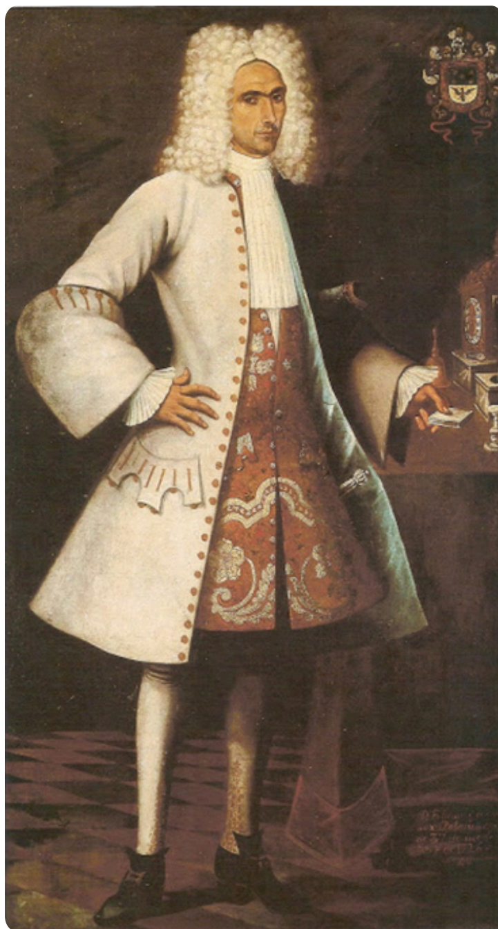
Figura 2: Anónimo. Don Feliciano Palacios y Sojo. 1726. Tomado de Duarte (1984: 77).

riqueza del retratado”, señala Carlos Duarte en referencia al reloj de mesa que aparece en esta pintura. (s/f: 15).