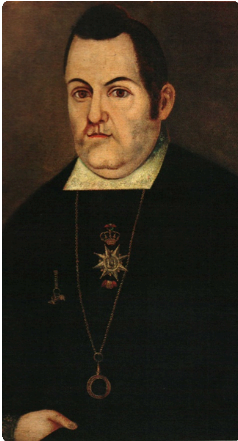
Figura 3: Anónimo. El Oidor y doctor don José Domingo Rus y Ortega de Azaraullía. Maracaibo, 1813. Tomado de Duarte (1984: 189).