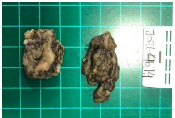
FIGURA 2. Foto de muestra enviada a histopatología de biopsia excisional pericardio