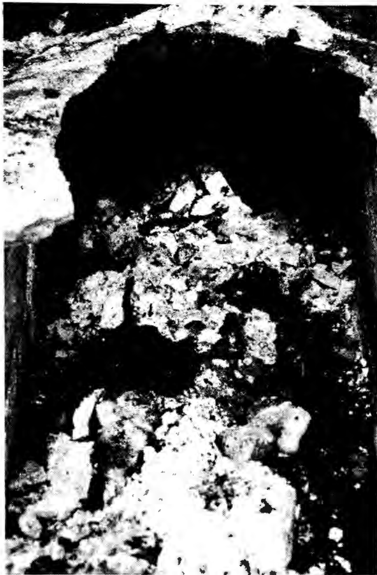
Foto 2: Esqueleto en posición extendida. Nótese los restos de cal y tela.