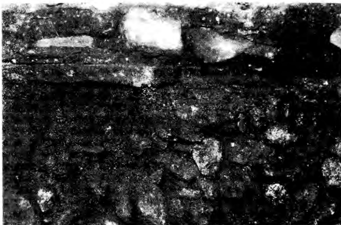
Foto 4: Diferentes pisos de la Capilla El Carmen.