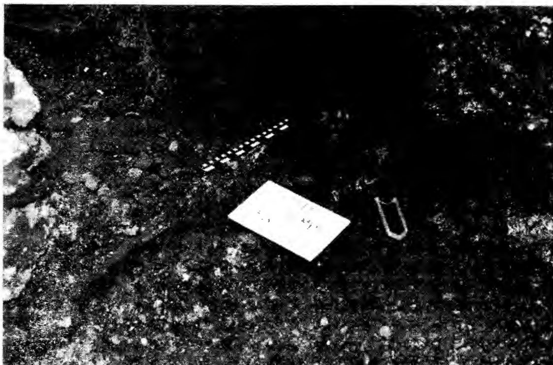
Foto 3: Extremidades inferiores del individuo Nº 3