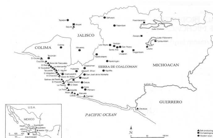
Figura 1. Mapa de la costa de Michoacán y Colima, mostrando los principales sitios productores de sal, visitados por el autor en 2000.

En la primavera del 2000 hicimos una investigación etnoarqueológica en las salinas de La Placita de Morelos, poblado enclavado en la costa de Michoacán (Figura 1). En Abril de 2016 regresamos al lugar para darnos cuenta de que las salinas fueron abandonadas desde hace varios años pues los antiguos salineros han emigrado o se dedican a otras actividades. Ha sucedido lo que ya se anticipaba en el estudio original (Williams 2003, 2015, 2016): ha desaparecido por completo la tradición salinera en el área bajo estudio, que tenía una antigüedad de por lo menos 500 años (Acuña, 1987). Lo que sigue a continuación es un “rescate etnográfico” de esta tradición salinera. Al final del texto presento una reflexión sobre las implicaciones culturales de la desaparición de esta industria tradicional.