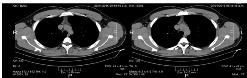
Figura 2. Tomografía de Tórax contrastada 6 meses después del tratamiento