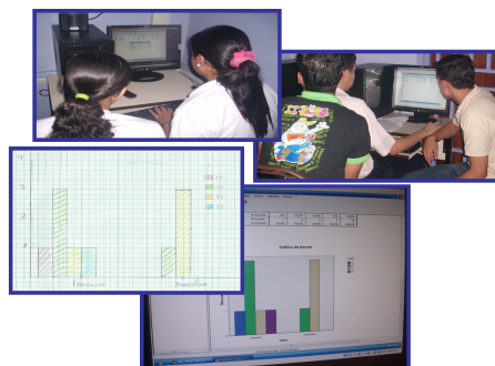
Figura 3: Práctica en el CBIT con el software SPSS.

En el transcurso de la actividad se observó que los integrantes de cada grupo se intercambiaron entre ellos mismos el manejo del computador para realizar la práctica y así lograron la participación de todos, a pesar de los pocos equipos disponibles (sólo funcionaban 9 computadoras de 20). Fácilmente los alumnos aplicaron los procedimientos detallados en la guía práctica y con la ayuda de su docente y las investigadoras identificaron correctamente las ventanas, pestañas, menús e íconos del software. Luego introdujeron los datos, realizaron los pasos adecuados y pudieron comparar sus gráficos con los realizados manualmente, reforzando su aprendizaje. El uso del SPSS y el diseño de actividades adecuadas permitieron beneficios pedagógicos inmediatos porque el docente y sus estudiantes, en forma cooperativa, exploraron y construyeron las ideas y los conceptos estadísticos contemplados en el programa de Matemática.