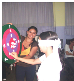
Figura 2: Juego “tiro al blanco”.

Luego se desarrolló la Actividad 6 que consistió en un juego llamado “Tiro al blanco” (ver la Figura 2), con la finalidad de emplear los resultados obtenidos para calcular la media aritmética, lograr su comprensión significativa y motivar a los estudiantes durante el desarrollo de la clase. El juego consistió en que cada integrante, de los grupos conformados, colocó con los ojos vendados un dardo en el tablero y al final cada equipo contó la cantidad de dardos colocados en las diferentes posiciones del tablero (7, 8, 9 y 10 puntos) y obtuvo el promedio aplicando los conocimientos compartidos en la clase teórica.