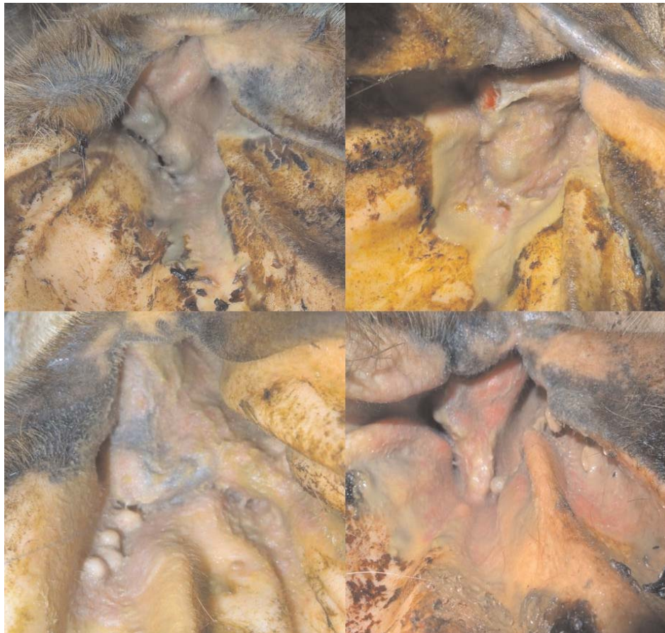
FIGURA 1. OTITIS CLÍNICA CON OTORREA, ACOMPAÑADA DE MATERIAL PURULENTO.

En Colombia sólo existe un reporte de frecuencia de presentación de la enfermedad en el departamento de Córdoba con un 63,2% [5], siendo muy inferior a la encontrada en el presente estudio. Resultados similares se dieron en Brasil, es así como Leite y col. [8] reportaron 93% en el estado de Minas Gerais, y Verocai y col. [22] 90,9% en Rio de Janeiro. Resultados inferiores fueron reportados por Vieira y col. [23] con 78,43% en el estado de Goiás y Duarte y col. [7] con 60,1% en el estado de Minas Gerais.