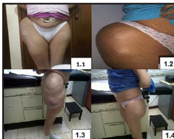
Fig. 1: 1.1) Fotografía de la paciente en bipedestación de frente, y 1.2) Proyección anteroposterior acercamiento, nótese las lesiones tumorales próximas a ambas articulaciones de la cadera. 1.3) Proyección lateral derecha y 1.4) Proyección lateral izquierda.

Al examen físico se evidencian lesiones eritematosas difusas en antebrazos cerca de la articulación de la muñeca, disminución de la estatura de aproximadamente 5 cms, dedos en palillo de tambor y tumor de 40 x 20 cm aproximadamente en la cadera derecha y 10 x 10 cm en la cadera izquierda, ambos sólidos, pétreos, no móviles y poco dolorosos de 1 año de evolución ( figura 1 ).