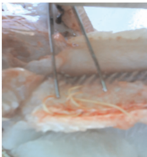
FIGURA 3. FOTOGRAFÍA DE LARVA (L3) EN CAVIDAD DEGESTIVA DE PESCADO CAPTURADO EN MEDANO BLANCO ESTADO FALCÓN.