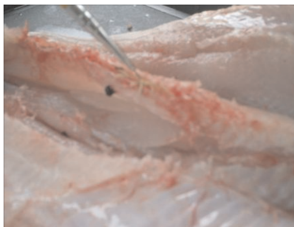
FIGURA 2. FOTOGRAFÍA DE DEBRIDACIÓN DE MÚSCULOS DEL PESCADO CON PRESENCIA DEL LARVA (L3).