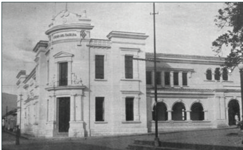
Edificio del Salón de Lectura inaugurado en el año 1938, y sede actual de la institución hasta el presente.

En pleno centro de la ciudad capital, al otro lado de una de las aceras más transitadas de San Cristóbal, yace un tesoro bibliográfico a la espera de ojos lectores que devuelvan las páginas de sus libros a la vida. Para conocer un poco más sobre el Salón de Lectura, conversamos