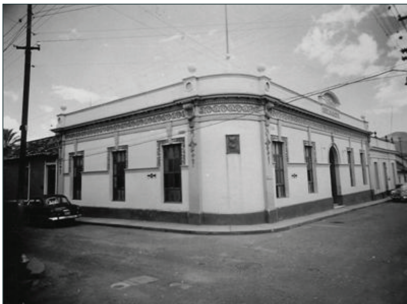
Primera sede propia del Salón de Lectura, en la esquina de la carrera 5 con calle 5, San Cristóbal, 1929.

– ¿Cuál es la historia de la sede de la institución?