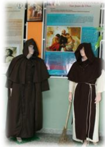
Figura 2. Exposición de santos enfermeros.

Constituirse en el primer museo de la Enfermería en Venezuela a través del acercamiento de un amplio público a sus exhibiciones, colecciones e investigaciones.