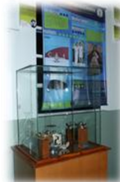
Figura 3. Exposición de lámparas de egresadas.