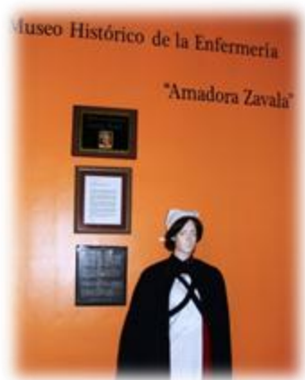
Figura 1. Entrada del Museo.