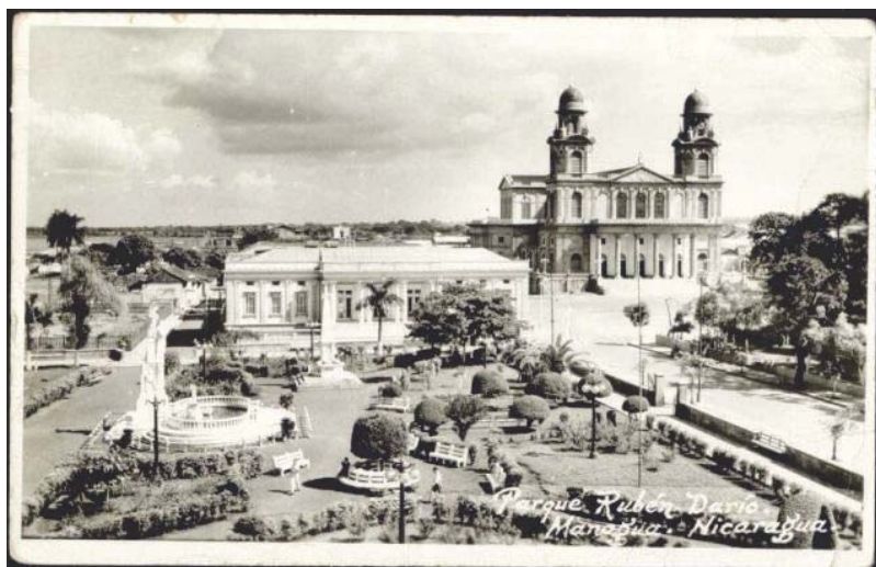
Managua. Capital de Nicaragua (1954).

Con respecto a la política exterior, en el contexto del enfrentamiento Este-Oeste marcado por la guerra fría, Nicaragua se convirtió en un leal aliado de los Estados Unidos y actuó como