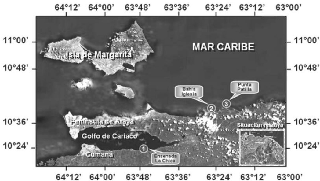
FIGURA 1. UBICACIÓN DEL ÁREA DE ESTUDIO Y LOCALIZACIÓN DE LOS SITIOS DE MUESTREO / LOCATION OF THE STUDY AREA AND SAMPLING PLACES.