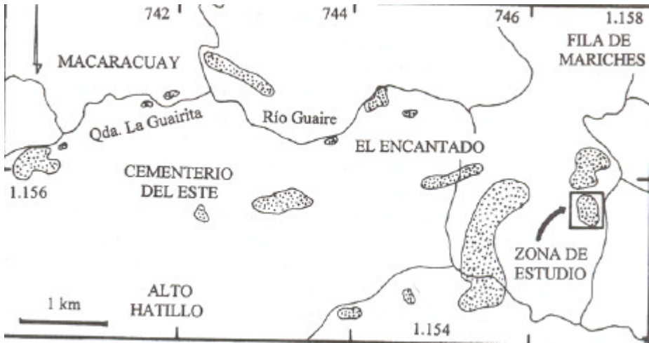
Figura 1. Mapa de ubicación de la zona de estudio al sureste de Caracas

hace unos 32 ka en un período de clima húmedo del Pleistoceno. En la actualidad y salvo contadas excepciones, las espeleotemas están inactivas, inclusive lo estuvieron durante los años 1998 y 1999 que fueron muy lluviosos, pero durante las exploraciones realizadas por miembros de la actual Sociedad Venezolana de Espeleología entre 1959 y 1967, gran parte de las cuevas tenían goteo, y muchas pequeñas represas de calcita (gours) estaban llenas de agua.