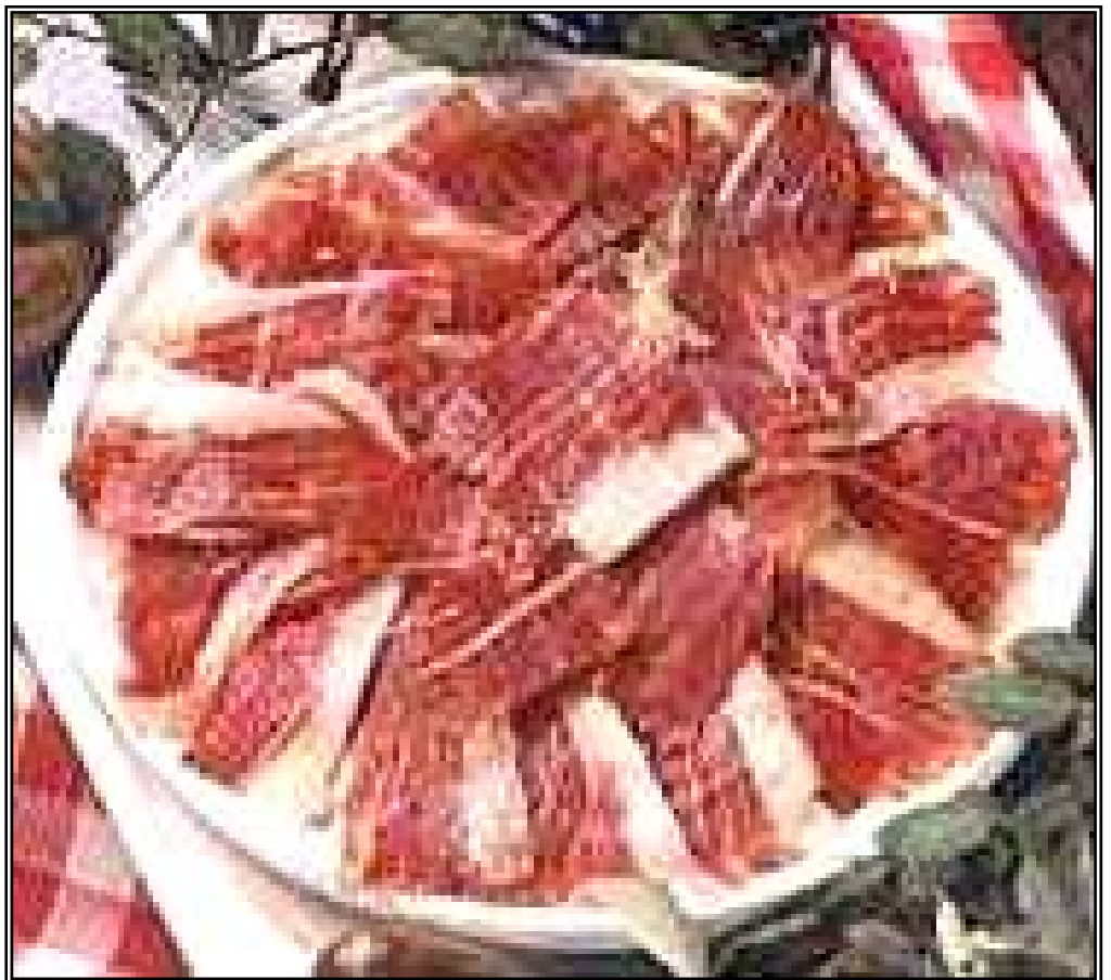
El jamón serrano e ibérico