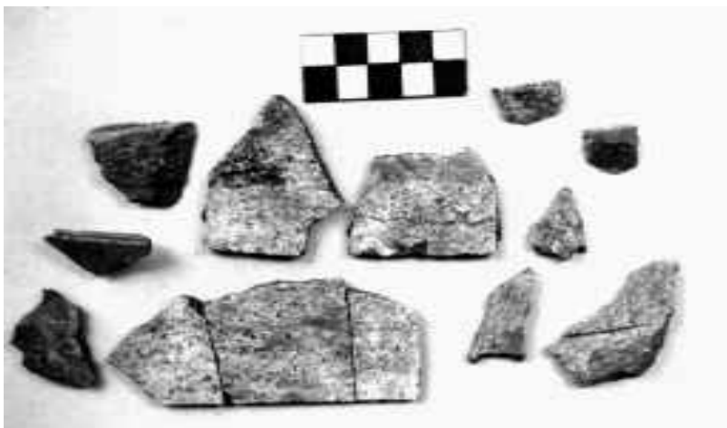
Fragmentos cerámicos Estilo Tabay

Las evidencias cerámicas encontradas en esta excavación permiten inferir que el sitio fue ocupado por grupos humanos portadores de alfarería perteneciente al Estilo Tabay cuya cronología se extiende desde el año 1050 a.C. al 1500 d.C. (Cruxent y Rouse, 1958: Tomo I: 253; Tomo II: 102)