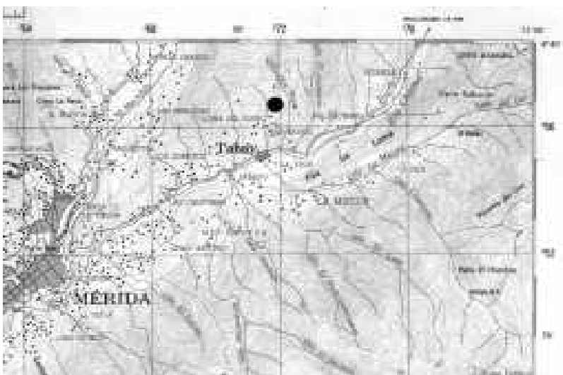
Mapa Mérida, Hoja 5941, DCN 1977, Esc. 1:100.000