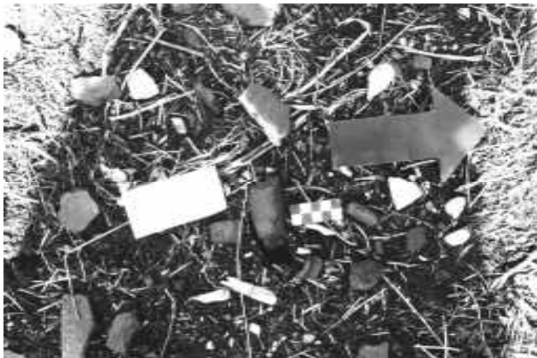
Detalle del pozo N° 1