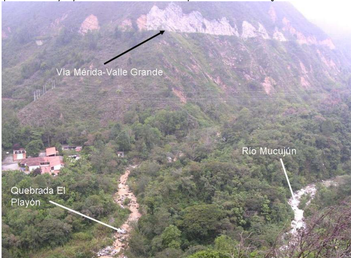
Figura 1: "El limpio y la Sucia". Aspecto de la quebrada El Playón y del Río Mucujún el día de hoy, luego de varias horas de lluvia intensa en la micro cuenca de esta quebrada

¿Qué está pasando? De acuerdo con la inspección que hemos realizado durante el día de hoy, pareciera que un grupo de nubes se ha concentrado sobre el área del cerro en cuestión y se han descargado allí en las últimas horas. Esta descarga de agua alcanza la micro cuenca de la quebrada El Playón y actualmente su caudal es comparable al del río Mucujún.