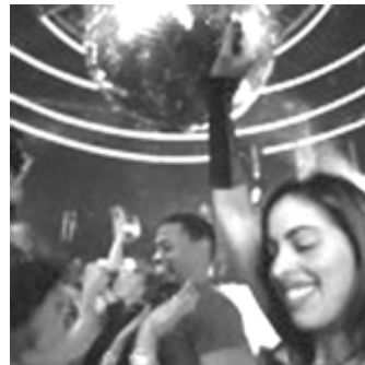
Fiestas raves: http://www.mx.geocities.com/corosamarcos/articulos/raves.htm