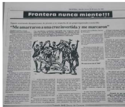
(20-06-1991) Diario FRONTERA.

Reportajes del DIARIO DE CARACAS (periódico nacional) insertadas en el Diario FRONTERA (MÉRIDA), como evidencia de que las noticias sobre los satánicos que ellos habían mostrado no eran falsas. Los reportajes de aquel periódico son mucho más elaborados que los del diario merideño, su apariencia de seriedad y pertinencia es mayor. Aunque sigue basado en rumores infundados, en imágenes (ver abajo) y ciertos sucesos como las desapariciones de personas en el Parámo, fueron usadas como pruebas de la existencia de grupos satánicos. Se echa mano de imágenes y fotografía ambiguas para darle mayor verosimilitud a las informaciones.