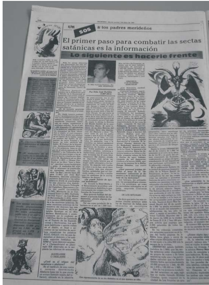
Otro reportaje sobre los satánicos. Contiene “información” general e “histórica” acerca de las sectas satánicas, sobre los supuestos rituales y las creencias diabólicas que practicaban. Diario FRONTERA (07-05-1991).