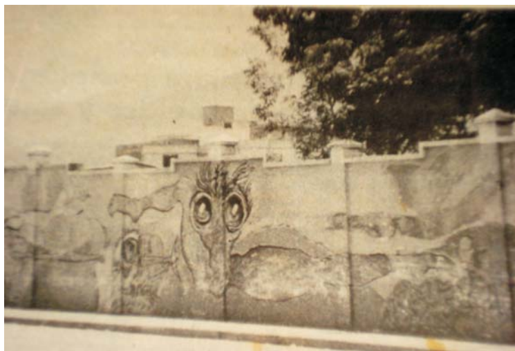
Mural en la Avenida Tulio Febres Cordero Diario FRONTERA (1991).

La prensa jugó un papel protagónico en estos sucesos. parece haber iniciado y fomentado la histeria colectiva sobre de los satánicos. Le dieron gran cobertura a las denuncias de varios dirigentes políticos que denunciaban a narcotraficantes, secuestradores y sectas satánicas como si fueran una sola cosa. También la contribución de la radio y la televisión nacional (“Alerta”, dirigido por Ledda Santodomingo, de RCTV) fue importante para detonar los sucesos. No obstante, no podemos obviar que mucho antes de 1991 había rumores, relatos o leyendas urbanas, como se les llama ahora, sobre la existencia de grupos satánicos en la zona de La Culata, en el norte de la ciudad.