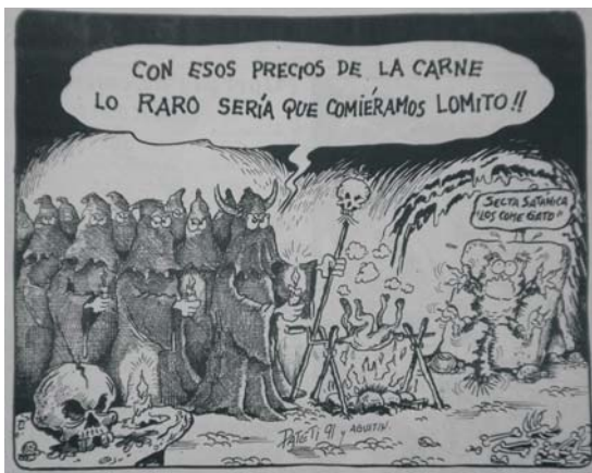
EL VIGILANTE Fotografía Francisco Franco

A pesar de que los sucesos de los satánicos significaron un gran miedo colectivo, el humor de los caricaturistas se expresó en los periódicos, mostrando lo absurdo y lo risible de las “actividades de los satánicos”. La palabra con que fueron apodados lo muestra; los peligrosos satánicos eran llamados por todos como “Los Comegatos”.