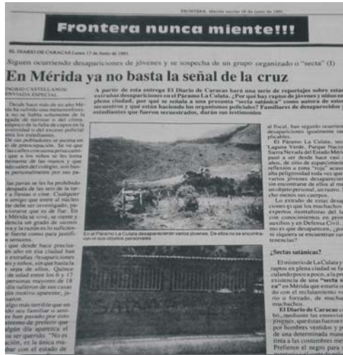
(18-06-1991) Diario FRONTERA.

Reportajes del DIARIO DE CARACAS (periódico nacional) insertadas en el Diario FRONTERA (MÉRIDA), como evidencia de que las noticias sobre los satánicos que ellos habían mostrado no eran falsas. Los reportajes de aquel periódico son mucho más elaborados que los del diario merideño, su apariencia de seriedad y pertinencia es mayor. Aunque sigue basado en rumores infundados, en imágenes (ver abajo) y ciertos sucesos como las desapariciones de personas en el Parámo, fueron usadas como pruebas de la existencia de grupos satánicos. Se echa mano de imágenes y fotografía ambiguas para darle mayor verosimilitud a las informaciones.