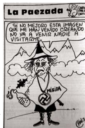
Fotografía Francisco Franco

Curiosamente algunos de los argumentos contra la imposibilidad de capturar algún satánico o de la concreción de las denuncias hechas contra algunas personas, era precisamente el "poder", casi mágico, que estos grupos supuestamente detentaban; así podían eludir fácilmente la justicia o cualquier otro intento de captura.