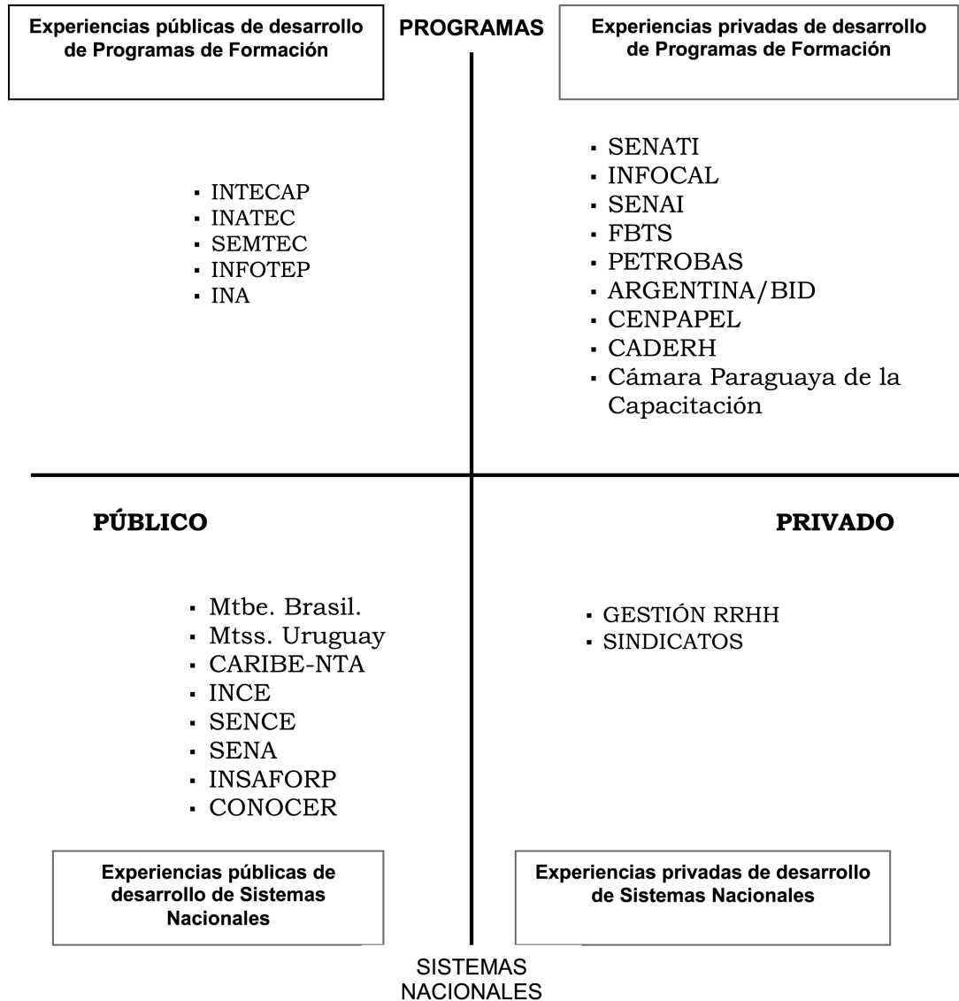
Figura 2 >> Experiencias Públicas y Privadas de Desarrollo de Sistemas Nacionales e Instituciones Latinoamericanas