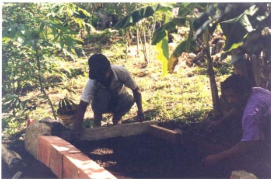
Figura 3. Huerto semillero café de la sierra