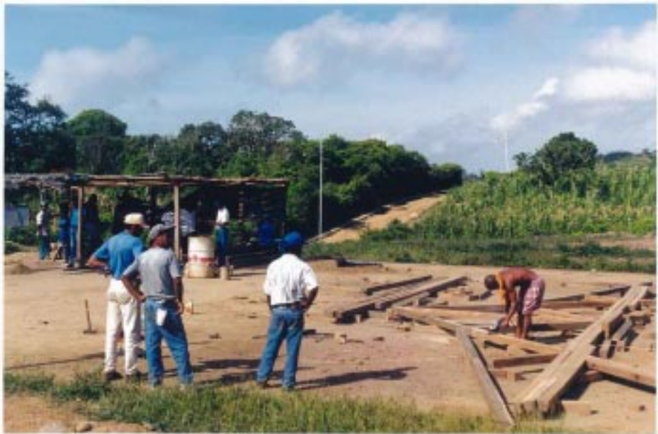
Figura 6. Talleres de participación comunitarios sobre uso y construcción con madera