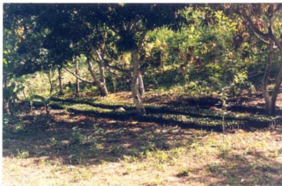
Figura 4. Vista de los huertos de café bajo sombra