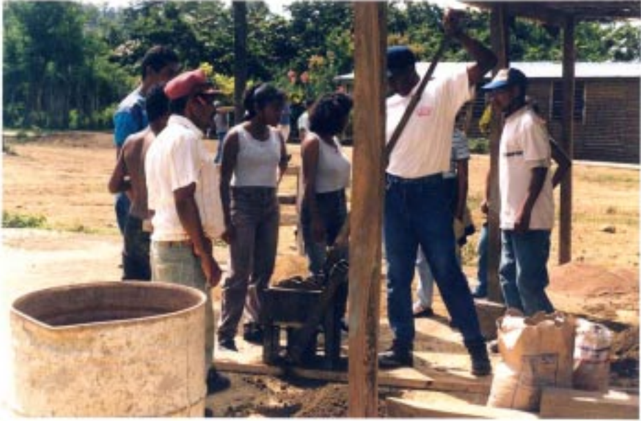
Figura 5. Talleres de capacitación comunitaria para la elaboración de los adobes tierra-cemento