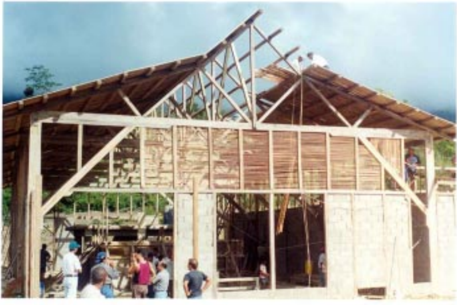
Figura 7. Vista externa del proceso monitoreado de la construcción comunitario de la estructura; los cerramientos con bloques, adobes y caña brava del CBC

recursos naturales, dando poder y real participación a las familias rurales sujetos y objetos del proceso; brindar satisfacción a las necesidades básicas de la existencia y crear buenas condiciones de vida para todos, estimulando la igualdad y evitando el intercambio desigual; permitir la existencia de errores sin que la integridad del ecosistema y de los recursos sea amenazada. Un tipo de desarrollo agropecuario más endógeno; es decir, centrado en la familia rural como protagonista de la solución de sus problemas y beneficiaria del fruto de su trabajo. Un desarrollo ambiental, económico, social y cultural que respeta el ambiente